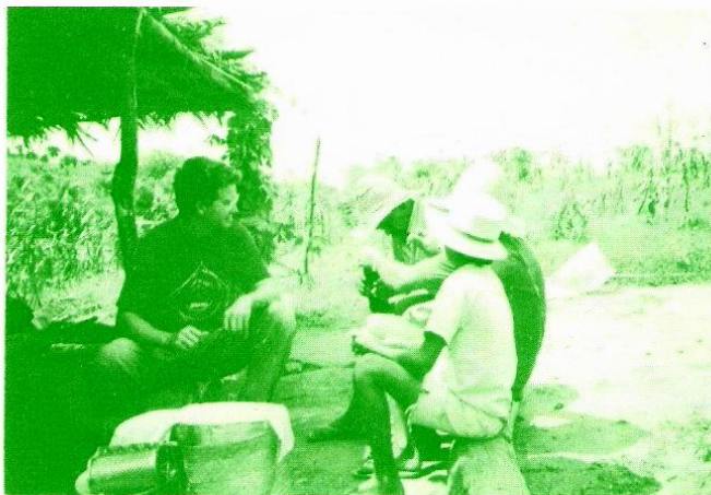
Comunità di Jabuticaba

Il sindacato dei piccoli produttori di Jabuticaba ha bisogno di una struttura per le riunioni ed il servizio agli iscritti, ma soprattutto per svolgere un lavoro di formazione, organizzazione e coscientizzazione dei contadini ed anche dei giovani della comunità e per realizzarla ha chiesto il nostro contributo.